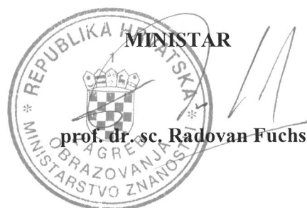
prof. dr. sc. Radovan Fuchs

Ova Odluka stupa na snagu danom donošenja.